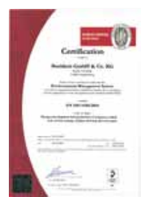
Zertifikat EN ISO 14001:2004 Certificate EN ISO 14001:2004