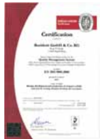
Zertifikat EN ISO 9001:2008 Certificate EN ISO 9001:2008