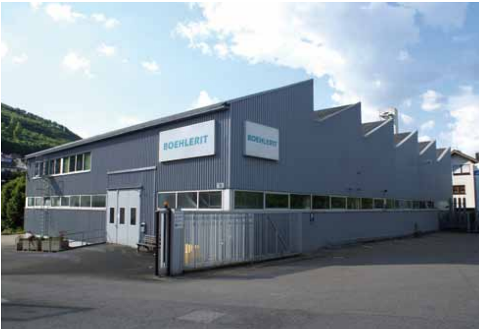
Oberkochen in Deutschland / Oberkochen in Germany

In 1998 a further carbide production for saw tips and tailor made parts in a rapid production line was established. Synergies with Leitz and the LMT Alliance partners are used by the advantage of customers world wide.